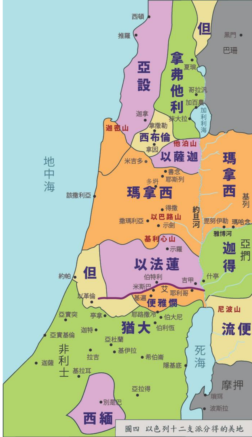
圖四 以色列十二支派分得的美地