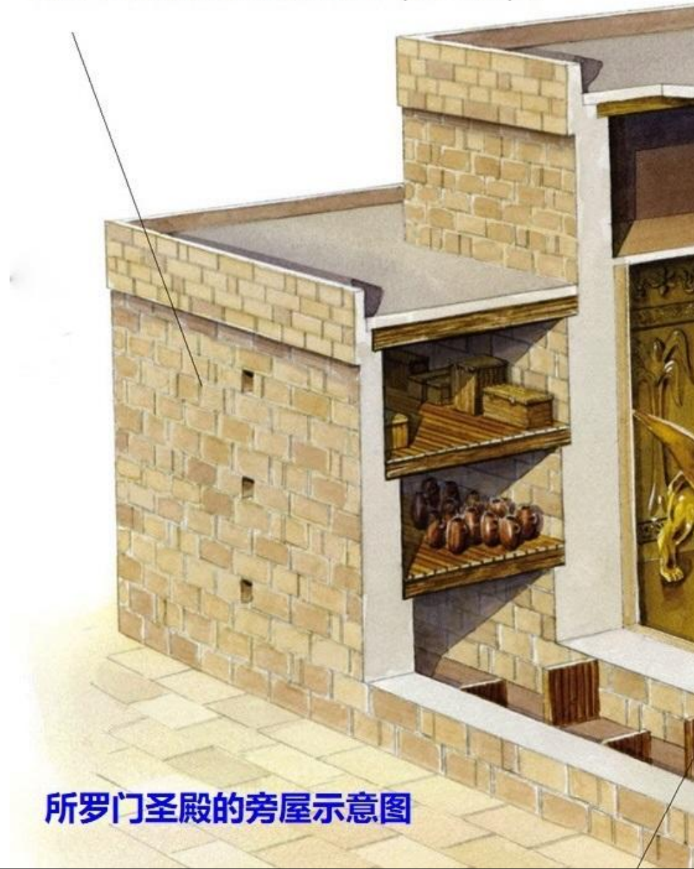
所罗门圣殿的旁屋示意图

下层宽五肘，中层宽六肘，上层宽七肘。殿外旁屋的梁木搁在殿墙坎上，免得插入殿墙（王上六5）。每层高五肘，香柏木的栋梁搁在殿墙坎上（王上六10）。