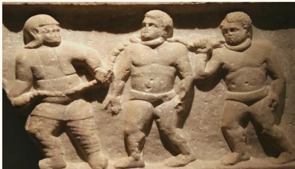
上图：主后二世纪士每拿的罗马大理石浮雕，描绘两个带着颈圈的奴隶。现藏于牛津Ashmolean博物馆。

v1 保罗并没有要求作主人的信徒释放奴隶，而是釜底抽薪、提醒他们谨记「你们也有一位主在天上」，最终都要向主交帐。不管主仆关系是以奴隶制的形式、还是以上下级或雇佣的形式出现，基督都是主仆双方的主。主人或仆人对待彼此的态度，取决于自己与天上的主的关系。