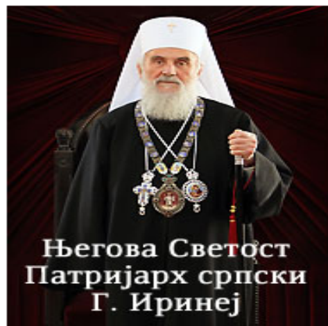
Његова Светост Патријарх српски Г. Иринеј

Устоличење Његове Светости Патријарха српског Г. Иринеја Пећка Патријаршија 3. октобар 2010.