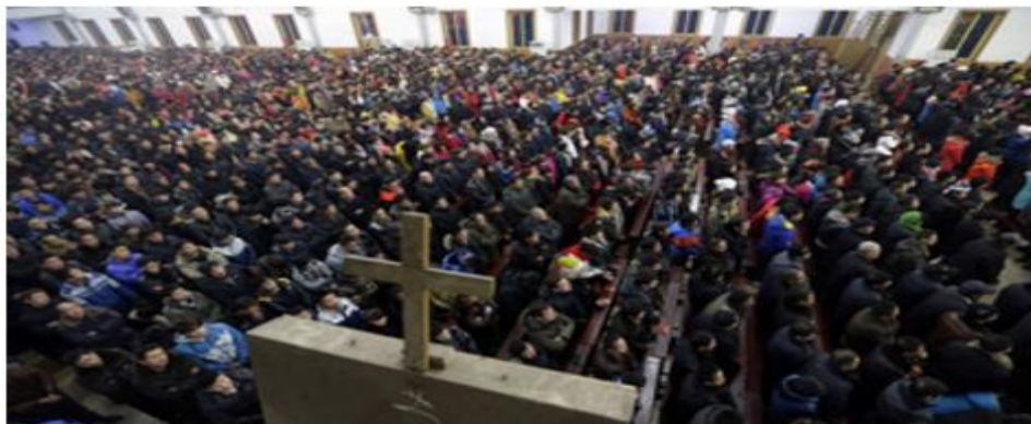
Megachurch in China

As part of a possible passing of the baton, China is now sending missionaries – especially to North Korea.