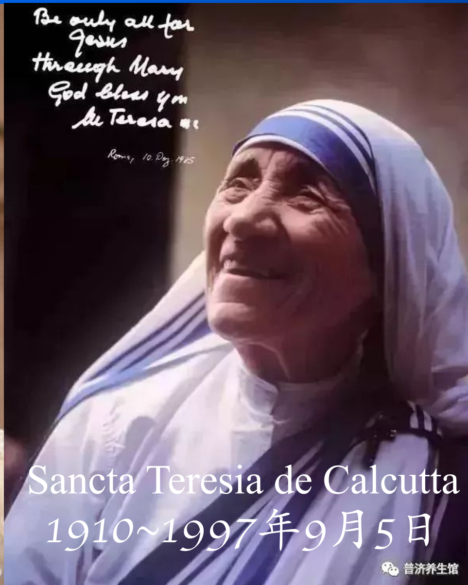
Sancta Teresia de Calcutta 1910~1997年9月5日